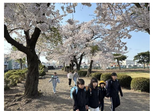
【今年の北園小 “桜トンネル”】

今年度も、全ては太陽っ子たちのために、保護者や地域の皆様と連携し、つながりを大切にしながら、職員一同尽力して参ります。皆様のご協力をよろしくお願ひいたします。