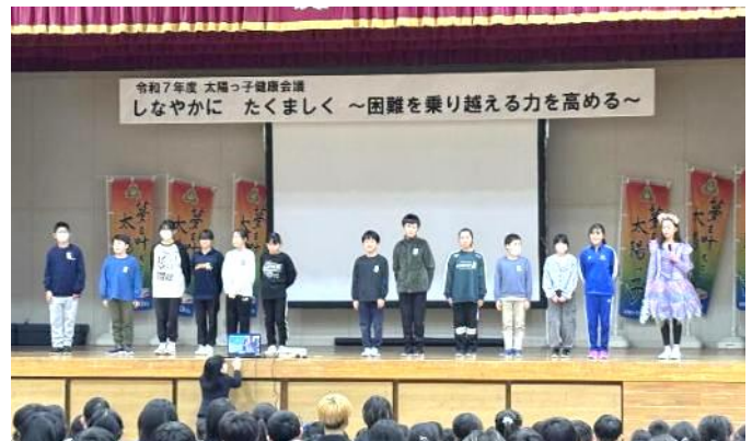
保健委員会による発表 心の悩みを寸劇で紹介