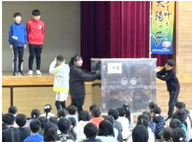
給食委員会「コンテナに注意」