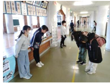
生活委員会 「挨拶運動開催中」

北園小学校は、児童会の活動も活発です。5・6年生が10ある委員会のいずれかに所属し、自分たちでできることを考えて活動しています。また、活動の様子や願いを、全校集会の場で発表することも行っています。