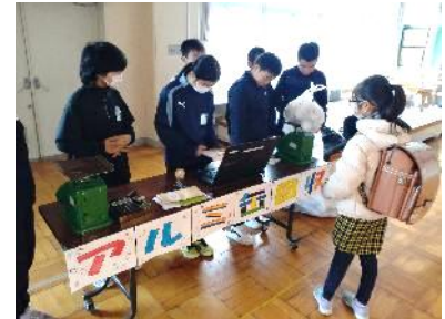
ボランティア委員会「アルミ缶回収」