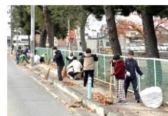
PTA環境奉仕作業。寒い中、ありがとうございました。