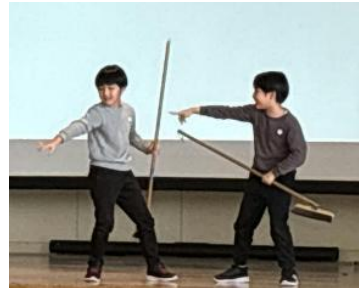
環境委員会「ほうきの使い方」